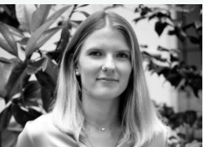
Victoria Chargée d'Affaires