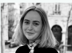
Marie Contrôle financier