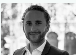
Aymeric Relations Investisseurs